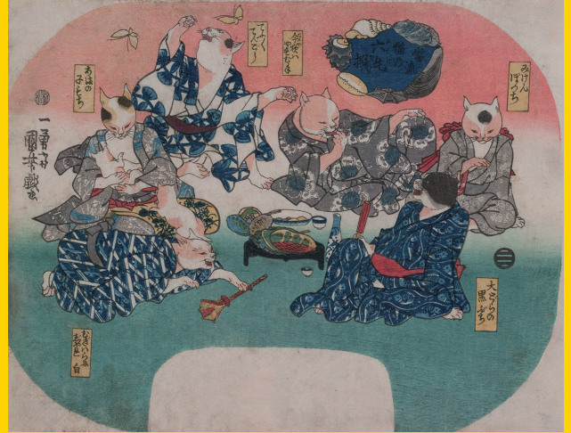
▲当流猫の六毛撰 歌川国芳画 個人蔵