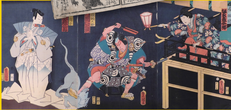
▲浮世絵「伽羅先代萩」 三代歌川豊国画 仙台市博物館蔵