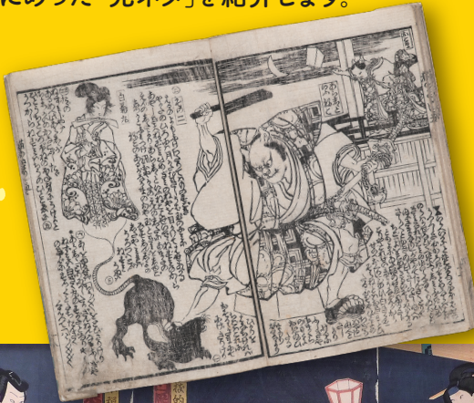
▲朧月猫の草紙 五編 山東京山作・歌川国芳画 個人蔵