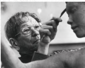
佐藤 忠良 (1912-2011 大和町出身)