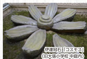
伊達冠石「コスモス」 (旧大張小学校 中庭内)