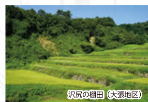
沢尻の棚田 (大張地区)