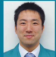
第4回ゲストスピーカー