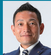
第3回ゲストスピーカー