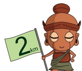
広瀬川沿い マラソンマーカー