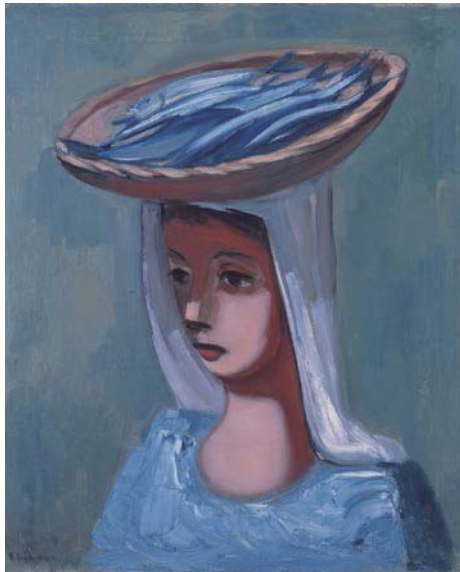
海老原喜之助《ポアソニエール》1935年、麻布、油彩