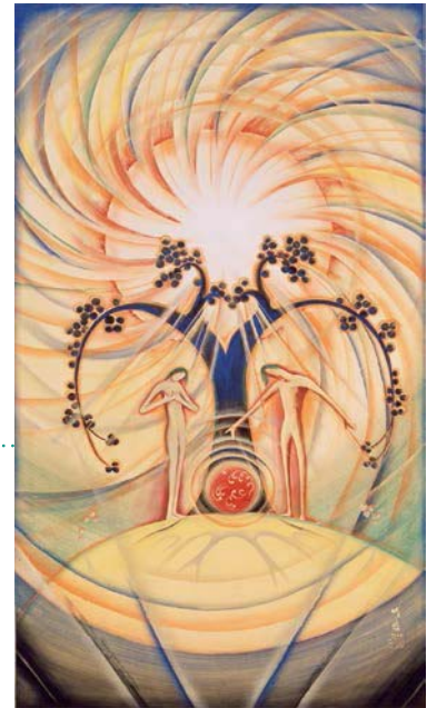
尾竹竹坡《太陽の熱》(三幅対の一)1920年、絹本着色