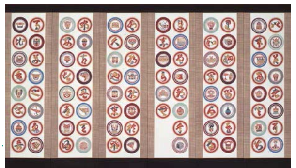
芹澤銈介《木綿地型絵染六曲屏風「丸紋伊呂波」》1963年、木綿、型絵染