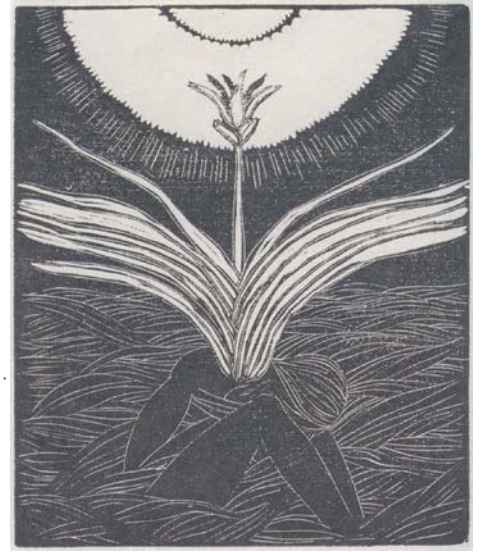
田中恭吉《冬虫夏草》1914年、紙、木版 (公刊「月映」III)