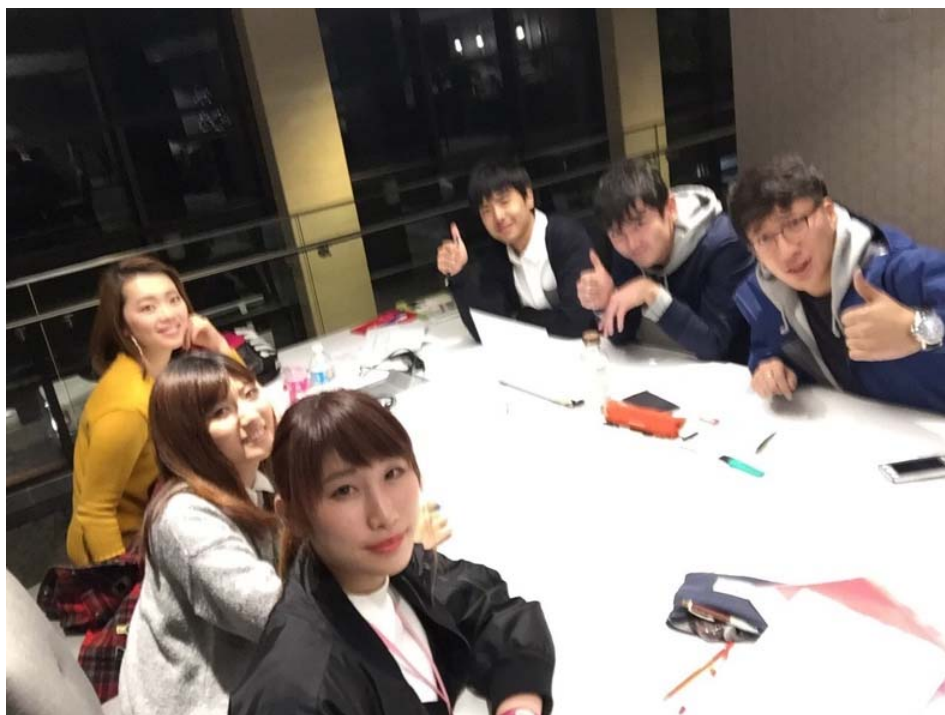
アクションプラン報告会の事前準備

このような刺激的な体験を基に私達グループ3は、東北工業大学の学生中心にヒューストンの良さ・アメリカの良さを知ってもらいます！実際に見て肌で感じるアメリカは刺激的で興奮するものです。加えて、テキサスの同年代の人にも日本の若者文化を発信していきます！