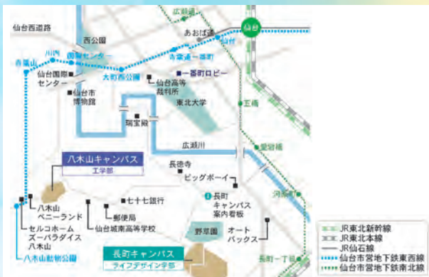
●八木山キャンパス

[東北工業大学 八木山キャンパス 132 教室] 〒982-8577 仙台市太白区八木山香澄町 35 番 1 号 ※地下鉄八木山動物公園駅から徒歩 10 分 シャトルバス運行・路線バスあり・学内駐車場あり